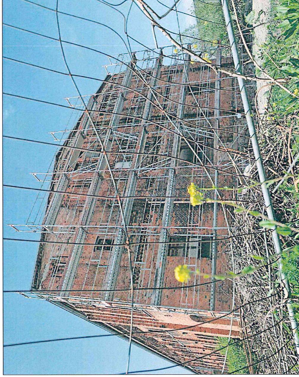
Wurde 1860 gebaut und steht unter Denkmalschutz; der alte Zollspeicher am Eisenbahndock.

Als Stein 2012 erstmals seine Entwürfe für den alten Zollspeicher präsentierte, ging er bereits von einer Investitionssumme im zweistelligen Millionenbereich aus. Ein ganz ähnliches Gebäude aus der Hand des gleichen Architekten befindet sich - allerdings schon saniert - in Leer. In den ersten Entwürfen Steins war noch ein Hotelbetrieb geplant. Doch dafür fand sich kein Investor. 2016 wurde umgeplant zu einem