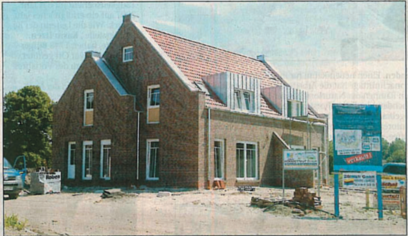
Diese beiden Häuser können sicherlich bereits in Kürze bezogen werden.

Außerdem wird Architekt Paul Stein vor Ort sein und über die Häuser informieren, die direkt am Wasser gebaut werden. „Die Besucher können sich in einer der Rohbau-