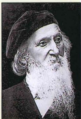
Bausubstanz machte ihn zum Vorreiter der Denkmalpflege im norddeutschen Raum und darüber hinaus.

Ab 1863 war er Konsistorialbaumeister der hannoverschen Landeskirche, ab 1849 Lehrer und ab 1878 Professor der Baukunst am Polytechnikum in Hannover und Gründer der Hannoverschen Architekturschule, Mitglied der königlich preußischen Akademie der Künste in Berlin, Mitglied der Akademie der bildenden Künste in Wien, Ehrenmitglied der Akademie der schönen Künste in Stockholm sowie Ehrenbürger der Städte Einbeck und Hildesheim. Sein Engagement für den Erhalt und die Pflege historischer