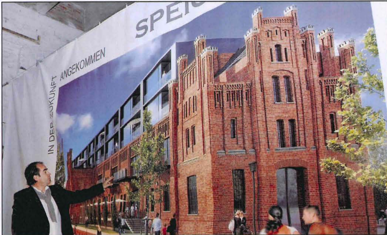
Der Bauingenieur und sein Entwurf: Paul Stein entwickelte mit seinem Büro ein Konzept für den alten Zollspeicher.

Für ihn kam nur eine Nutzung des alten Zollspeichers in Frage, die auch zum Teil öffentlich zugänglich ist. Stein: „Das wäre doch schade, wenn man ein solches wunderschönes Gebäude nicht auch zum