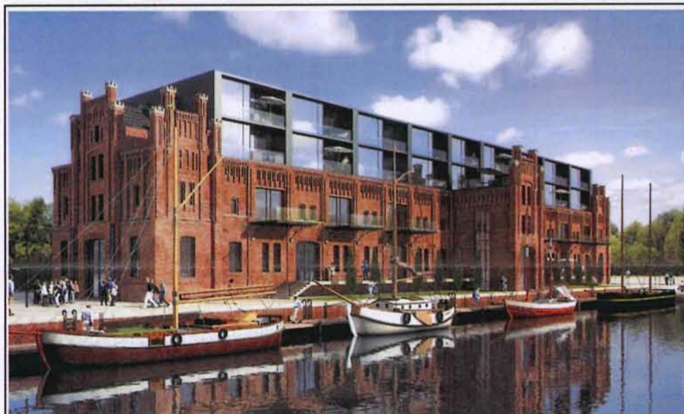
Anlehnung an das Original: Die alte Grundform soll wieder hergestellt werden.

Für Stein bedeutet der Umbau einen weiteren Schritt zur Komplettierung des neuen Wohngebiets rund um das Eisenbahndock. Gemeinsam mit seinem Partner, dem Reeder Werner Bockstiegel, mit dem er bereits Wohnhäuser an der Eisenbahndockwasserseite gebaut hat, wird er auf der gegenüberliegenden Seite noch weitere Einzelhäuser erstellen.